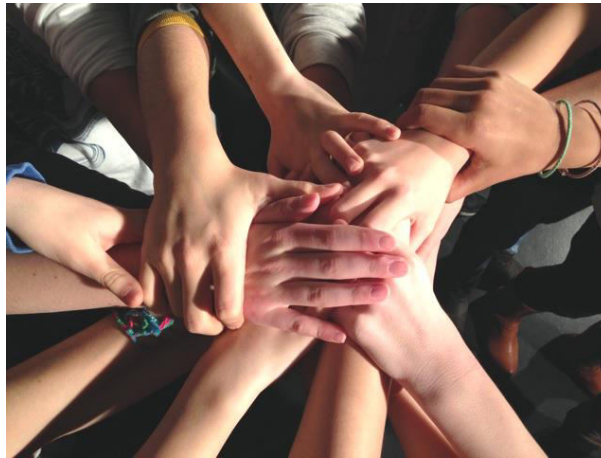
Die SMV im Schuljahr 2016/17

Verantwortung übernehmen für die Gesellschaft